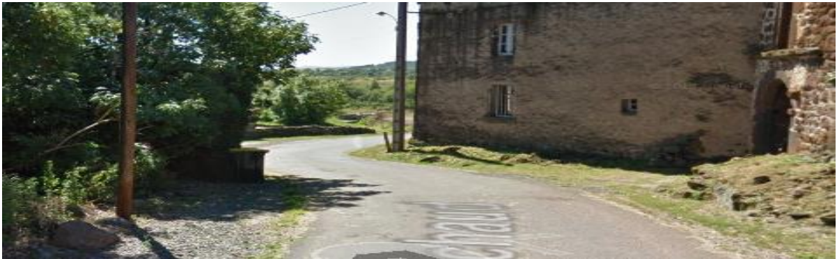
(A gauche 1 ère route vers maison Chabannes, 2 ème vers maison Sarret, à gauche direction Concouret)